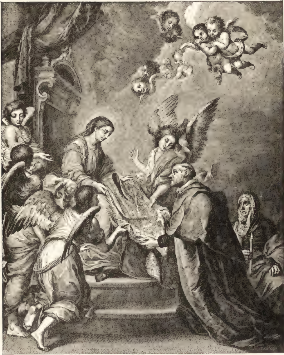
SAINTE ILDEFONSE RECEVANT LA CHASUBLE DES MAINS DE LA VIERGE.